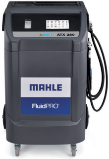
Resim 1: MAHLE FluidPRO® ATX 280

Birçok sürücü, otomatikleştirilmiş veya otomatik şanzımanlardaki yağın da düzenli olarak değiştirilmesi gerektiğini bilir. Öte yandan, çok az insan yağ ile şanzıman yıkama olanağının ve bunun avantajlarının farkındadır.